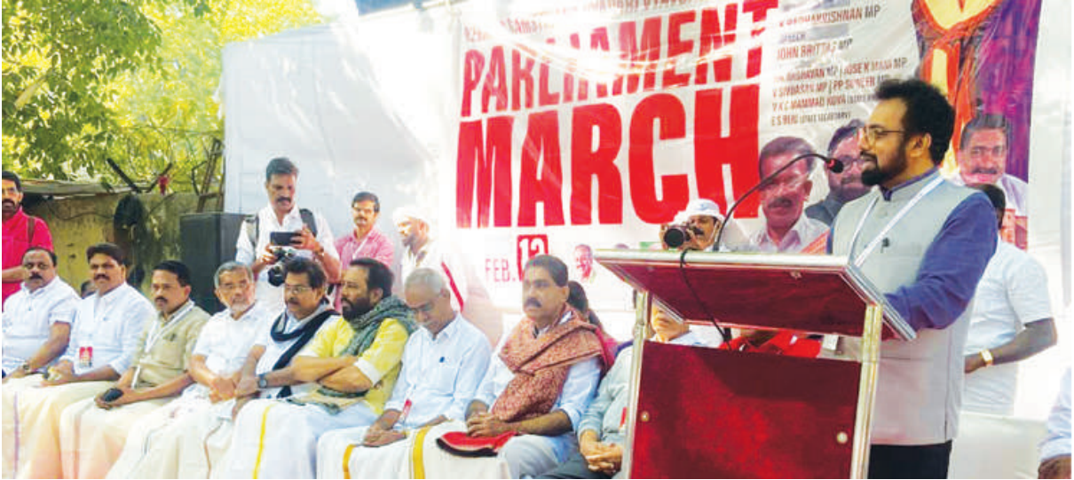
വ്യാപാരി- വ്യവസായി സമിതി നടത്തിയ പാർലമെന്റ് മാർച്ച് ജോൺബ്രിട്ടാസ് എം.പി. ഉദ്ഘാടനം ചെയ്യുന്നു

ചെറുകിട വ്യാപാരവ്യവസായ മേഖല അഭിമുഖീകരിക്കുന്ന പ്രശ്നങ്ങൾ കേന്ദ്രസർക്കാരിന്റെ ശ്രദ്ധയിൽ കൊണ്ടുവരുന്നതിനായി കേരള സംസ്ഥാന വ്യാപാരി വ്യവസായി സമിതി നടത്തിയ പാർലമെന്റ് മാർച്ച് ജോൺ ബ്രിട്ടാസ് എം.പി ഉദ്ഘാടനം ചെയ്തു. ജി.എസ്.ടി യിലെ അപാകതകൾ പരിഹരിക്കുക, കെട്ടിടവാടകയിലെ 18% ജി.എസ്.ടി ഒഴിവാക്കുക. വിലക്കയറ്റം