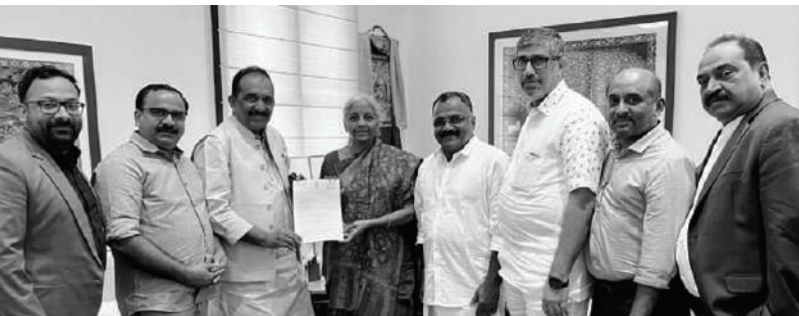
നാടൻ പലഹാരങ്ങളുടെ ഉയർന്ന നികുതി കുറയ്ക്കണമെന്ന് ആവശ്യപ്പെട്ടുള്ള കേരള ബേക്കറി ഓണേഴ്സ് ഫോറത്തിന്റെ നിവേദനം ചാലക്കുടി എം.പി ബെന്നി ബെഹനാൻ കേന്ദ്രമന്ത്രി നിർമ്മലാ സീതാരാമന് കൈമാറുന്നു

നിലവിൽ ബേക്കറിയിൽ വിൽക്കുന്ന പാഠമ്പരാഗതമായിട്ടുള്ള ഭക്ഷണങ്ങൾക്ക് 18% നികുതി കൊടുക്കേണ്ടി വരുമ്പോൾ കെ.എഫ്.സി പോലുള്ള സ്ഥാപനങ്ങളിൽ വിൽക്കുന്ന സാധനങ്ങൾക്ക് 5 ശതമാനമാണ് നികുതി. ലഡു, ജിലേബി, കാജുബർഫി എന്നിവയെ സ്വീറ്റ്മീറ്റ് എന്ന് പരിഗണിച്ച് നികുതി 5 ശതമാനമാക്കി കുറച്ചിരുന്നു. ആവിയിൽ പുഴുങ്ങിയെടുക്കുന്ന മണിക്കൂറുകൾ മാത്രം ആയുസുള്ള കൊഴുക്കട്ട. ചക്കഅട എന്നിവയ്ക്ക് കടക്കം കൂടിയ